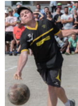
Quilles de 8