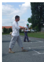
Quilles de 6