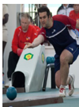
Ninepin bowling schere