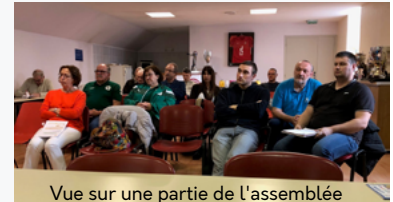
Vue sur une partie de l'assemblée

Un verre de l'amitié fourni par le club local dirigé par Michel TURLIER clôtura cette réunion.