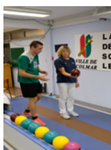
Ninepin bowling classic