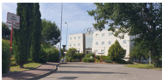
Maison des Sports à Labège

Vous trouverez plus d'informations sur le site fédéral.