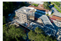
Creps de Toulouse

Le dossier est disponible sur le site fédéral : ici