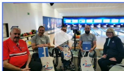
Para Bowling : viens faire tomber les préjugés !