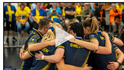
Revivez la finale par équipes des EWC 2024